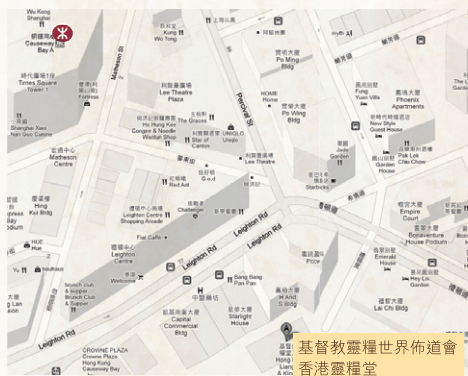
基督教靈糧世界佈道會 香港靈糧堂